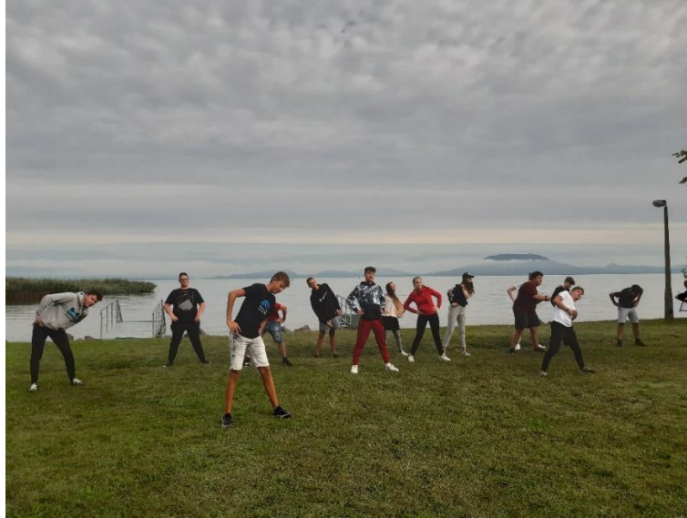
6. ábra Reggeli tesi

Előző este összeállítottunk egy izgalmas kvízt, ebben különböző témaköröket érintettünk: Schulek, sport, általános, vicces. A diákok csapatokban versenyeztek, a győztesek jutalmat kaptak.