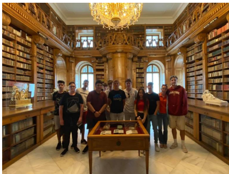
4. ábra Könyvtár

Vacsora után a következő programokból lehetett választani: labdarúgás, kosárlabda, asztalitenisz, majd lehetett filmet nézni.