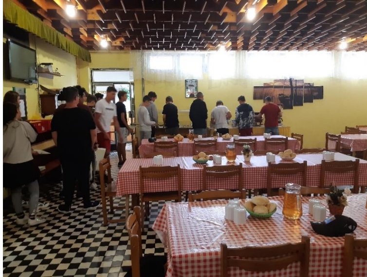
2. ábra Ebédlő

Egy városnéző túra után felkerestük a Festetics-kastélyt. Nagyon tetszett a diákoknak a kastély és a vadászati kiállítás is. Utána szabad program következett, majd elindultunk vissza a táborba.