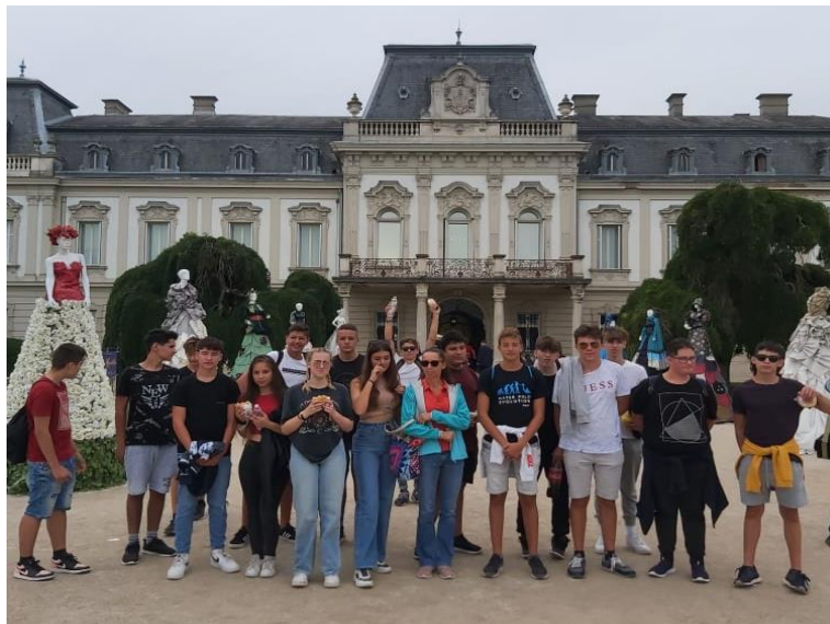
3. ábra Festetics- kastély

Egy városnéző túra után felkerestük a Festetics-kastélyt. Nagyon tetszett a diákoknak a kastély és a vadászati kiállítás is. Utána szabad program következett, majd elindultunk vissza a táborba.