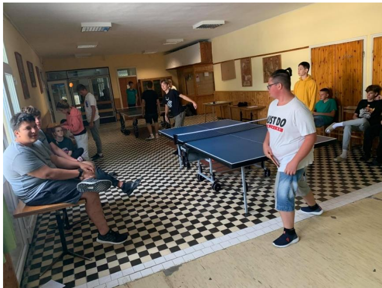
7. ábra Pingpong