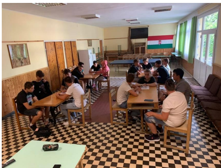
5. ábra Játsszunk

Vacsora után a következő programokból lehetett választani: labdarúgás, kosárlabda, asztalitenisz, majd lehetett filmet nézni.