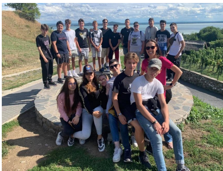
1. ábra Badacsony

Péntek reggel vonattal indultunk a Balatonra. Fenyvesen a szállásunk egy csendes, kellemes helyen volt, közel a centrumhoz. Elfoglaltuk a szobáinkat, megettük a finom ebédet, majd megkezdtük a programot. Fonyódra vonatoztunk át, onnan komppal mentünk Badacsonyra. Kellemes, nyári melegben indult a gyalogtúra fel a badacsonyi hegy tetejére. Útközben beszélgettünk, képeket készítettünk a mesés tájról. Utunk végén finom fagyival jutalmaztuk a diákok kitartását.